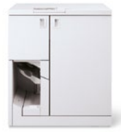
Xerox® Tape Binder