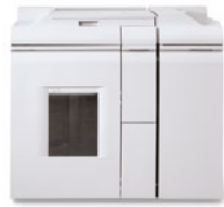
Bogenauslage- und Heftmodul – Direct Connect