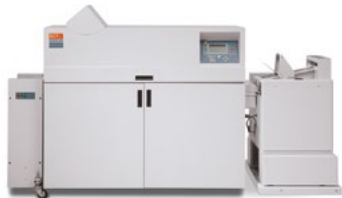
C.P. Bourg BDFNx Booklet Maker mit Square Edge-Modul