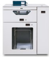
C.P. Bourg BSFx Dual-Mode Sheet Feeder