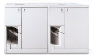
Xerox® Tape Binder Doppelkonfiguration