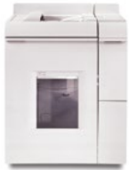
Bogenauslage- und Heftmodul