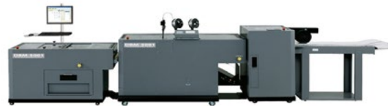
Inline-Booklet-Maker Duplo DBM-5001