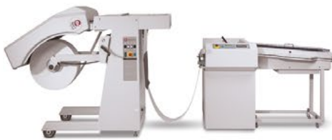
Lasermax Roll Systems SheetFeeder NV-R 1