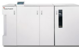
GBC® Fusion Punch® II mit Offset-Stapler