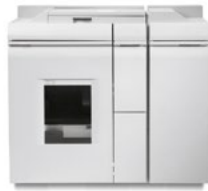
Bogenauslage- und Heftmodul Plus