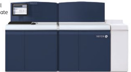
Xerox Nuvera 200/288/314 EA Perfecting Production System