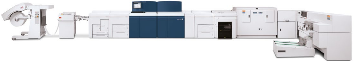
Xerox Nuvera® 314 EA Perfecting Production System mit Lasermax Roll Systems SheetFeeder NV-R, Xerox® Produktionsstapler und Xerox® Book Factory