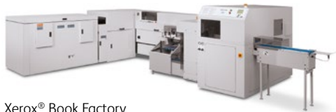
Xerox® Book Factory